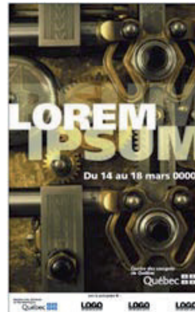
Exemple du point 6

Il importe de chercher à obtenir la meilleure visibilité et de privilégier le coin inférieur droit comme emplacement.