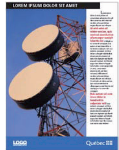
Exemple du point 7